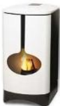
Neptuni: + Drag 39900 kr, 3-6 kW,