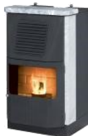
Mysinge+ Sten+ Drag. 39900 Kr 3-6 kW