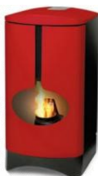
Neptuni: 39900 kr, 3-6 kW,