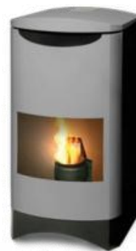
Ekerum: 39900 kr, 3-6 kW,