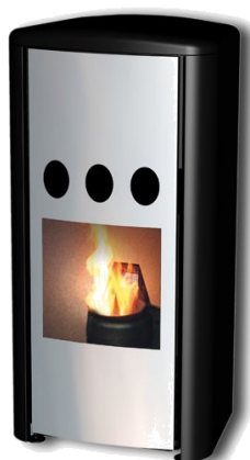
Lilla Frö+ Drag 27850 Kr 3-5kW

Drag Rökgasfläkt Passar alla KMP kaminer